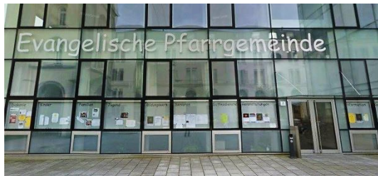
Gemeindezentrum Martin-Luther-Platz 2 4020 Linz