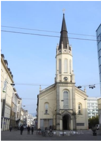
Martin-Luther-Kirche Martin-Luther-Platz 1 4020 Linz