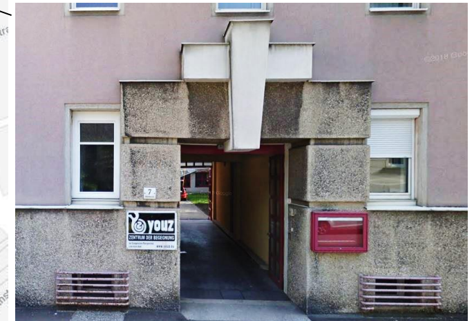
YouZ – Zentrum der Begegnung Südtirolerstraße 7 4020 Linz