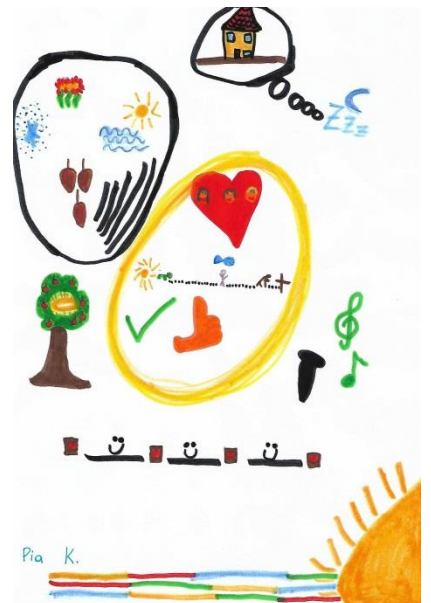
Zeichnung: Pia K.