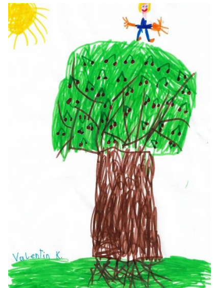
Zeichnung: Valentin K.

Gott sitzt in einem Kirschbaum und ruft die Jahreszeiten aus. Er träumt mit uns den alten Traum vom großen Menschenhaus. Wir sind die Kinder, die er liebt, mit denen er von Ewigkeit zu Ewigkeit das Leben und das Sterben übt. Er setzt auf uns, er hofft auf uns: dass wir uns einmischen, dass wir seine Revolution der Liebe verkünden, von Haus zu Haus an die Türen nageln, heiß in die Köpfe reden, in die Herzen versenken, bis die Seele wieder ein Instrument der Zärtlichkeit wird! Und die Zärtlichkeit musiziert und triumphiert. Und die Zukunft leuchtet.