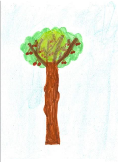
Zeichnung: Lisa E.