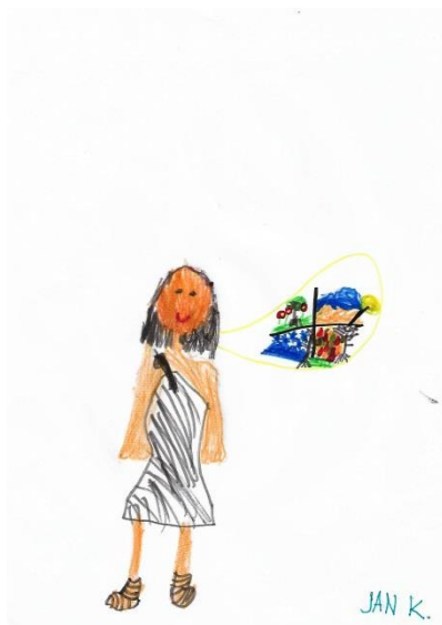
Zeichnung: Jan K.